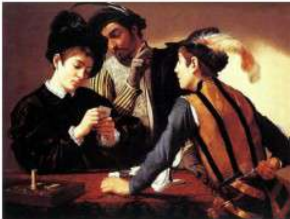
Figura de Caravaggio. A Trapaça, 1594.

12. Caravaggio com a frase “A arte se alimenta da própria arte” foi uma inspiração para muitos pintores, entre os quais Cézanne.