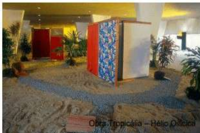
Figura de Hélio Oiticica. Tropicália, 1967.

O termo Tropicália nasce como nome da obra de Hélio Oiticica exposta na mostra Nova Objetividade Brasileira, realizada no Museu de Arte Moderna do Rio de Janeiro – MAM/RJ, em abril de 1967. A obra pode ser descrita como um ambiente labiríntico, com plantas, areia, araras, poemas-objetos, capas de Parangolé e um aparelho de televisão.