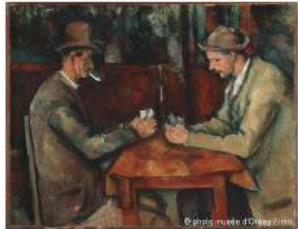
Figura de Paul Cézanne. Os jogadores de cartas, 1892-95. (Acessado em 01/09/2022 www.historiadaarte.com.br )

Há um tema comum entre as obras acima. A respeito delas, assinale a opção que identifique essas representações.