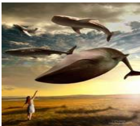
Figura de Mario Koller. FLYING WHALES, 2021.

34. Analise a imagem para responder à questão.