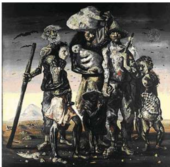
Figura de Portinari, C. Os Retirantes, 1944. Óleo sobre tela (190 x 180 cm) Museu de Arte de São Paulo, SP.

Com base na Figura e nos conhecimentos sobre a obra de Portinari, identifique a assertiva INCORRETA .