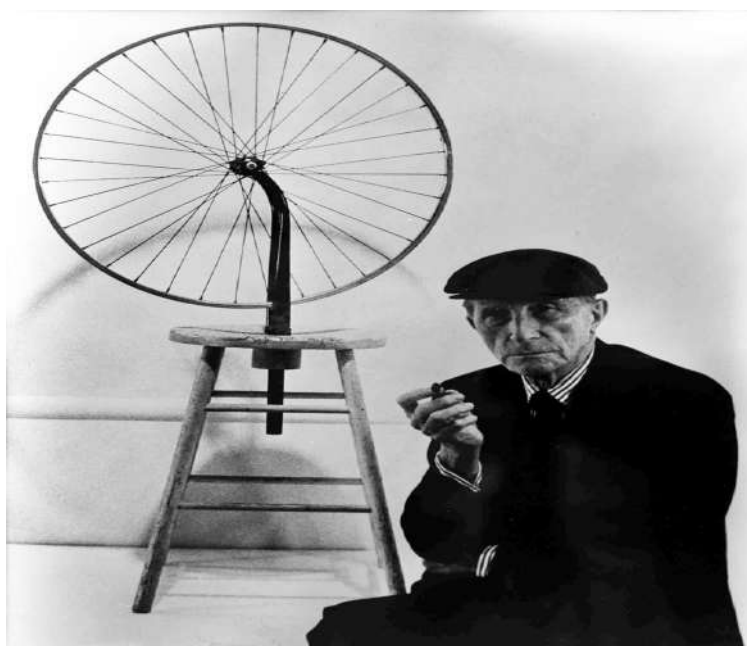
DUCHAMP, Marcel. Roda de Bicicleta , 1913. Museu de Arte Moderna de Nova York.