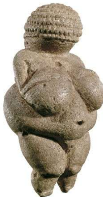
Vênus de Willendorf

Acessado em 01 setembro de 2022 - http://https://www.historiadasartes.com/imagens