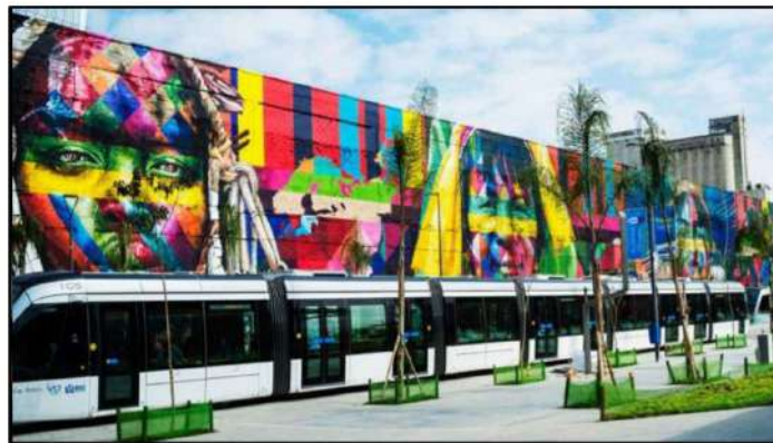
Mural Etnias (RJ, 2016). Acessado em 01 setembro 2022 - https://eduardokobra.com/projeto/26/etnias

O mural “Etnias” de Eduardo Kobra, que fica no Boulevard Olímpico da Praça Mauá, possui 15 metros de altura e 170 metros de comprimento e retrata cinco rostos indígenas de cinco continentes diferentes: os Huli da Nova Guiné (Oceania); os Mursi da Etiópia (África); os Kayin da Tailândia (Ásia); os Supi da Europa e os Tapajós das Américas. Esse mural teve como objetivo representar a paz e a união entre os povos. Pode-se dizer que essa obra é arte pública por ser