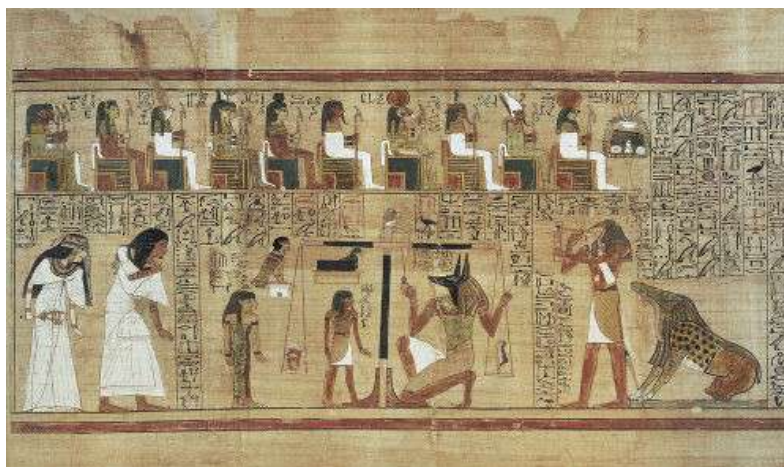
Cena de Osíris em Papiro

Acesso em: 01 setembro de 2022 - www.historiadarte.com.br