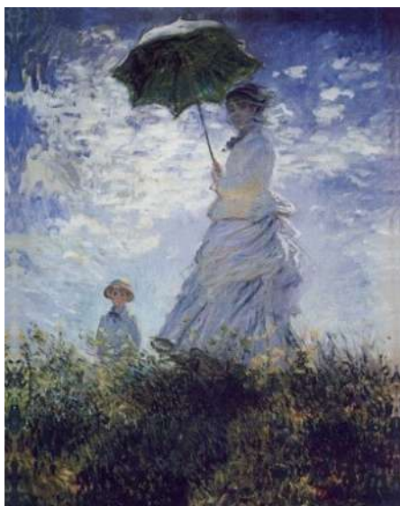
Figura de Claude Monet. Mulher com Sombrinha, 1875.

Acessado em 01/09/2022 www.historiadaarte.com.br