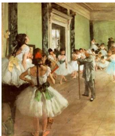
Figura de Edgar Degas. Aula de Dança, 1874.

Acessado em 01/09/2022 www.historiadaarte.com.br